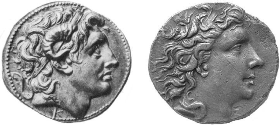
Fig. 1-2. 1: Avers af sølvmønt ( tetradrakme ) med Alexander med Zeus Ammons horn. 2: Avers af sølvmønt ( tetradrakme ) slået under Mithradates VI i år 73 f.Kr. (SNGCop 18, nr. 236). Bemærk ligheden i udformningen af de to portrætter. Mithradates er på prægningstidspunktet omkring 60 år gammel.