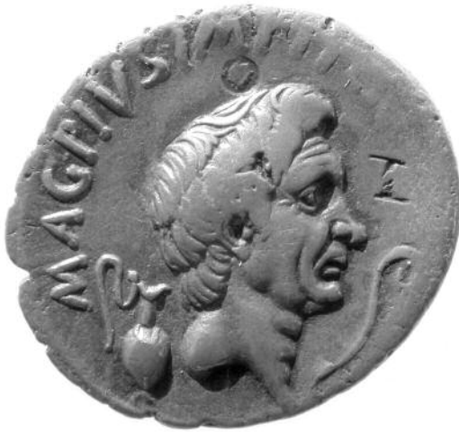
Fig. 4. Avers af sølvmønt ( denar ) med posthumt portræt af Pompejus den Store slået af hans sønner på Sicilien i 42-40 f.Kr. ( Antikmuseet i Århus, Rep. 280 ).

romersk kejsertid, og er altså ikke samtidigt med Mithradates. Vi kan derfor desværre ikke med sikkerhed vide, om det kopierer en tidligere statue af Mithradates eller om der er tale om en rent romersk frembringelse, og følgelig om Mithradates selv nogensinde lod sig portrættere med Herakles' løveskind.