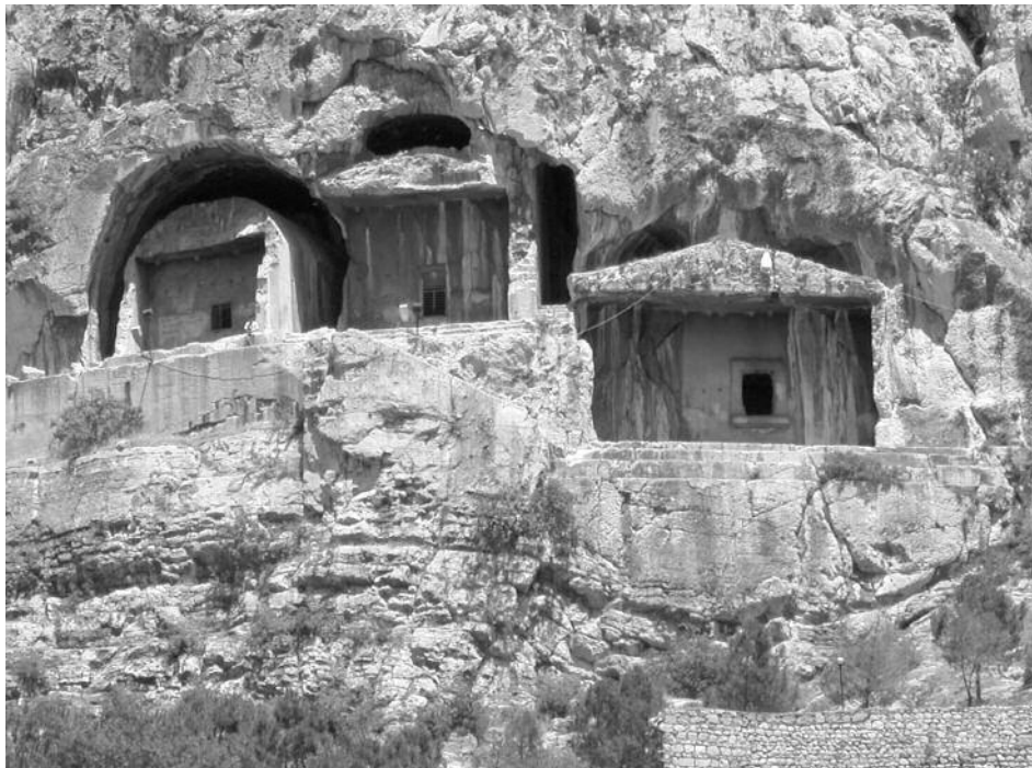
Fig. 7. Tre af de i alt fem kongegrave i Amaseia.

nibal, der kom hærgende ind i Italien over Alperne. Endelig kunne Pompejus' modstandere have brugt historien til at sværte Pompejus til ved at hævde, at mens Pompejus legede Alexanders felttog mod Perserriket, var Italien truet af den fjende, som han oprindeligt var blevet sendt ud for at besejre. Pompejus' fravær fremhæves da også som en vigtig pointe i en af kilderne (Dio Cassius 37.11). Hvilken af de anførte muligheder, der er den rigtige forklaring, kan næppe afgøres endeligt. Detaljeringsgraden af de bevarede kilder tillader det ikke, og dermed fortaber spørgsmålet om Mithradates' genialitet eller galskab i den sidste fase af hans liv sig også.