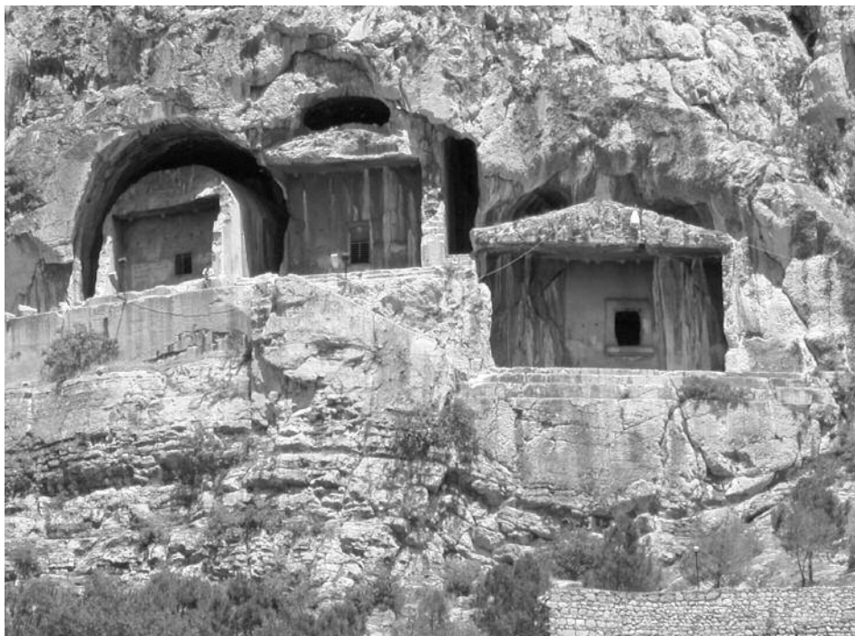
Fig. 7. Tre af de i alt fem kongegrave i Amaseia.

nibal, der kom hærgende ind i Italien over Alperne. Endelig kunne Pompejus' modstandere have brugt historien til at sværte Pompejus til ved at hævde, at mens Pompejus legede Alexanders felttog mod Perserriket, var Italien truet af den fjende, som han oprindeligt var blevet sendt ud for at besejre. Pompejus' fravær fremhæves da også som en vigtig pointe i en af kilderne (Dio Cassius 37.11). Hvilken af de anførte muligheder, der er den rigtige forklaring, kan næppe afgøres endeligt. Detaljeringsgraden af de bevarede kilder tillader det ikke, og dermed fortaber spørgsmålet om Mithradates' genialitet eller galskab i den sidste fase af hans liv sig også.