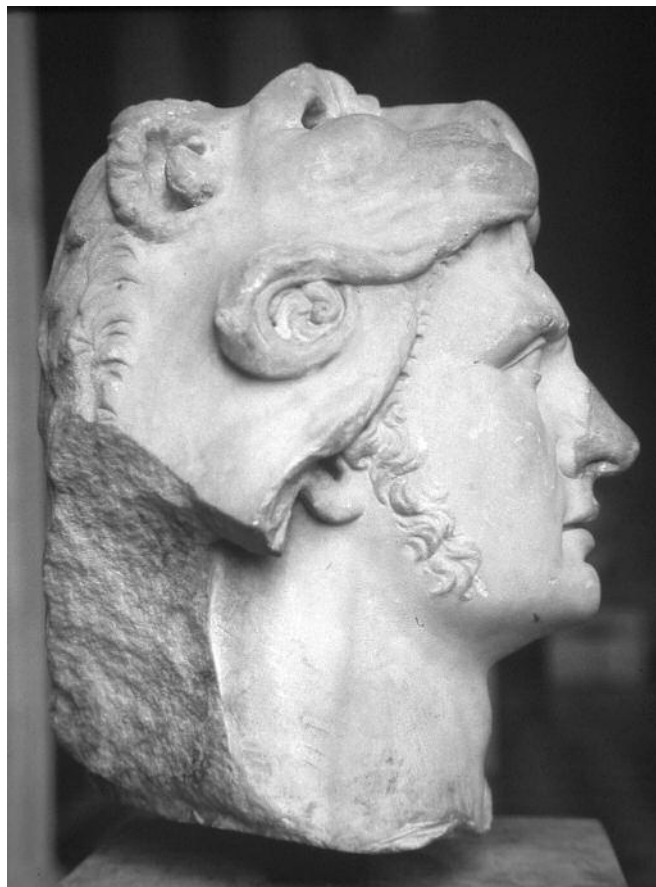
Fig. 3. Portræt i Louvre af Mithradates VI iført løveskindshjelm som Herakles eller Alexander.

Krig ændres møntportrættet pludselig markant (Fig. 2). På trods af at Mithradates på dette tidspunkt er over 50 år fremstår han nu yngre og mere dynamisk end på de tidligere portrætter, og der er ikke nogen tvivl om, hvem portrættet hentyder til. I lighed med Alexanderportrættet har Mithradates fået fyldige læber og et fremtrædende hageparti, skægget er væk, og ligesom hos Alexander rejser håret sig over panden. Det kan undre, at det først er to år henne i krigen mod Rom at Mithradates begyndte at udnytte mønternes potentiale for at sprede budskabet om grækernes nye befrier i skikkelse af Alexander, men måske har frygten for at svække tilliden til mønterne vejet tungere i krigens indledende fase. Blandt de få portrætstatuer, der med nogenlunde sikkerhed kan identificeres som Mithradates VI, har et portræthoved af høj kvalitet i Louvre tiltrukket sig størst opmærksomhed (Fig. 3). Det viser Mithradates iklædt løveskind svarende til møntfremstillingerne af Alexander. Imidlertid skal portrættet dateres til