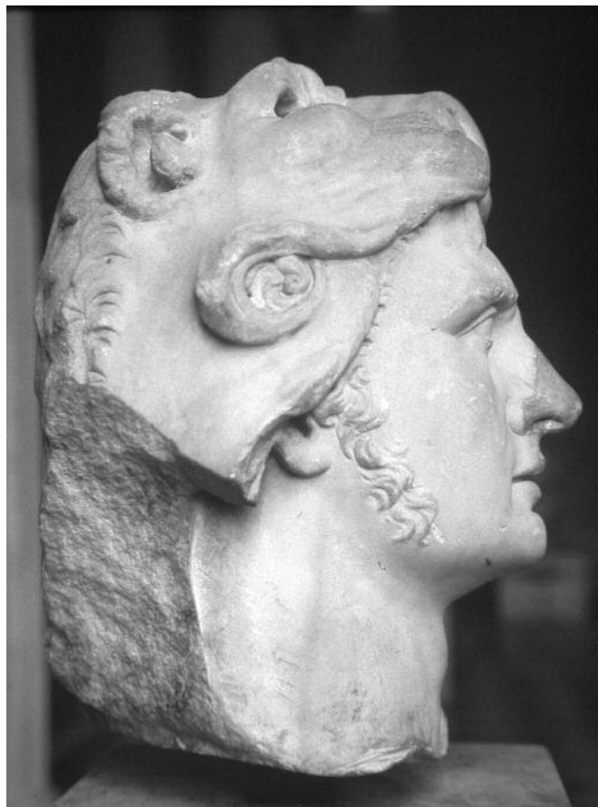
Fig. 3. Portræt i Louvre af Mithradates VI iført løveskindshjelm som Herakles eller Alexander.

Krig ændres møntportrættet pludselig markant (Fig. 2). På trods af at Mithradates på dette tidspunkt er over 50 år fremstår han nu yngre og mere dynamisk end på de tidligere portrætter, og der er ikke nogen tvivl om, hvem portrættet hentyder til. I lighed med Alexanderportrættet har Mithradates fået fyldige læber og et fremtrædende hageparti, skægget er væk, og ligesom hos Alexander rejser håret sig over panden. Det kan undre, at det først er to år henne i krigen mod Rom at Mithradates begyndte at udnytte mønternes potentiale for at sprede budskabet om grækernes nye befrier i skikkelse af Alexander, men måske har frygten for at svække tilliden til mønterne vejet tungere i krigens indledende fase. Blandt de få portrætstatuer, der med nogenlunde sikkerhed kan identificeres som Mithradates VI, har et portræthoved af høj kvalitet i Louvre tiltrukket sig størst opmærksomhed (Fig. 3). Det viser Mithradates iklædt løveskind svarende til møntfremstillingerne af Alexander. Imidlertid skal portrættet dateres til