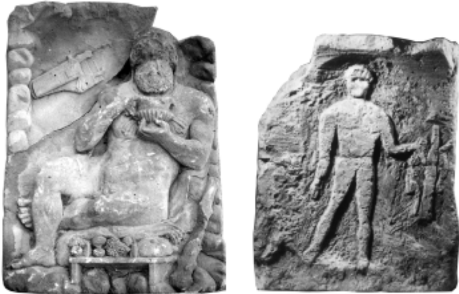
Fig. 5.1-2. Relieffer med afbildninger af Herakles. Til venstre (5.1) relief fra Saki med Herakles til bords holdende en kantharos , til højre (5.2) relief fra Panskoe I med en stående Herakles.

sætning til Parthenos vedbliver Herakles' popularitet ikke gennem århundrederne, i hvert tilfælde hvis vi skal dømme ud fra det numismatiske materiale. Allerede fra midten af 2. århundrede f.Kr. forsvinder han pludselig fra mønterne, og indtil den lokale udmøntning forsvinder endeligt i romersk tid findes ikke en eneste mønttype, der kan forbindes med Herakles.