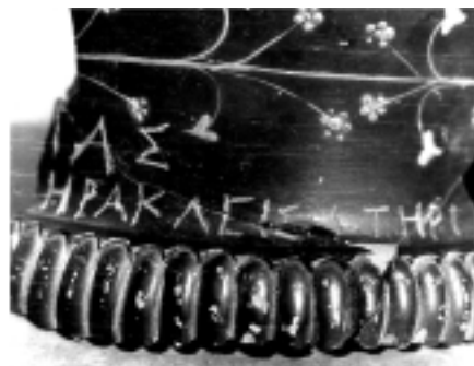
Fig. 8. Kantharos med dedikation til Herakles Soter fundet i bygning U7 i Panskoe I. Indskriften er det eneste sikre bevis for, at man i Chersones dyrkede Herakles som Soter (VS 1985).

Dedikationer til Herakles indridset på keramik forekommer i modsætning til Parthenos hyppigt på Chersones' bosættelser på det nordvestlige Krim. Den mest interessante stammer fra udgravningen af bygning U7 i Panskoe. I rum 97 nær det vestlige hjørne af hus 15, som regnes for hushelligdommen, blev der fundet en stor sortglaseret kantharos (Fig. 8) med en indridset dedikation til Herakles Soter (frelseren) (Stolba 1989). Denne indskrift bevidner for første gang, at Herakles blev dyrket i Chersones under tilnavnet Soter. Det eneste sammenlignelige fund er to graffitifragmenter fra det 4. århundrede f.Kr. fra Chersones, som lyder: "...] [...] og "...] [...]". Solomonik tolkede oprindeligt disse som dedikationer til Zeus Soter, men de refererer snarere til Herakles. For i modsætning til i Olbia og i Det bosporanske Rige var Zeus nemlig aldrig særligt populær i Chersones, og dedikationer til Zeus og Zeus Soter kendes herfra ikke tidligere end det 2. århundrede e.Kr.