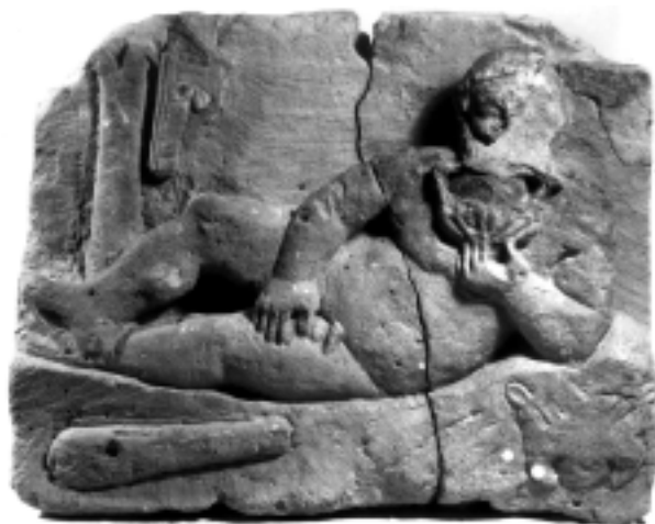
Fig. 6.1-2. Relieffer med afbildninger af Herakles. Øverst (6.1) relief fra Čajka, nederst (6.2) relief fra Mežvodnoe (JMH september 2002). Selvom Herakles-reliefferne fra Chersones' chora skal dateres omtrent samtidig, er der stor forskel i stil og kvalitet.