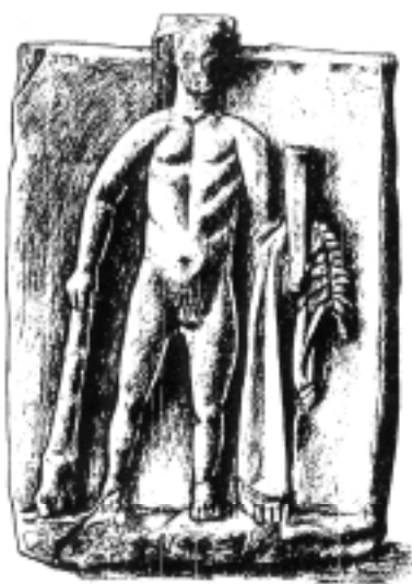
Fig. 7.1-3. Relieffer fundet i Čajka med afbildninger af en stående Herakles (Popova & Kovalenko 1996, 63-71; 2000, 117-124).

Terrakottastatuetter forestillende Herakles eller blot hans attribut køllen er mindre almindelige. Desværre er ingen statuetter bevaret intakt, men større fragmenter er i flere tilfælde fundet både på byens fjerne og nære chora , samt i byen selv (Belov 1970; Agrafonov 1997; Rusjaeva 2002). Her skal blot nævnes en terrakotta-kølle fundet på gården ved Vetrenaja Bugten, et fragment af en torso fra en stående Herakles i Belajus.